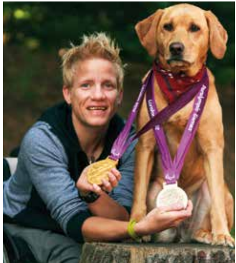
Marieke Vervoort, goud en zilver, Paralympics, London, 2012 mascotte W.E.M.M.E.L., expertisecentrum 'Waardig LevensEinde'

Sinds mijn papieren met betrekking op mijn levenseinde in orde zijn, dankzij LEIF en ULteam, ben ik bij wijze van spreken weer gaan “leven”. Met de gedachte dat ik niet onnodig hoeft af te zien als het te erg wordt, dat er een “noodrem” bestaat. Hierdoor is er een hele hoop stress van me afgevallen en kan ik opnieuw genieten van elk allerkleinste moment! Ik hoop dat het taboe rond het levenseinde wegvalt. Dit zou heel wat meer levenskwaliteit brengen!